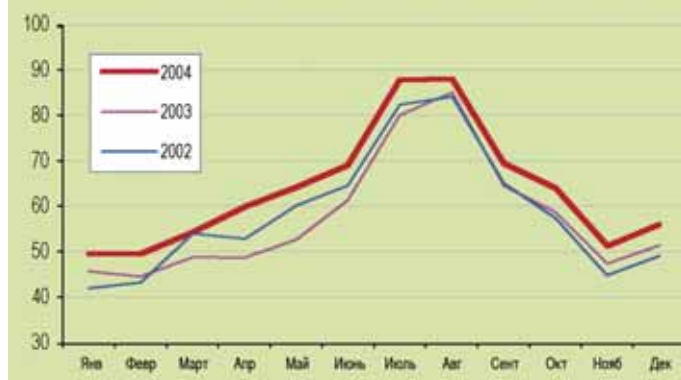
Въездной туризм по месяцам Международные туристские прибытия (миллионы)