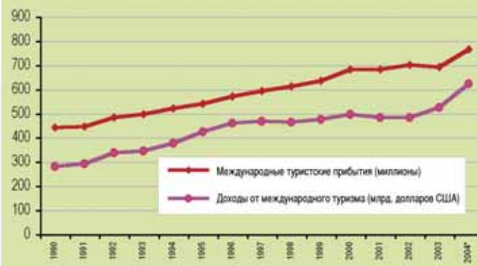
Въездной туризм, 1990-2004

Источник: Всемирная туристская организация (ВТО) ©