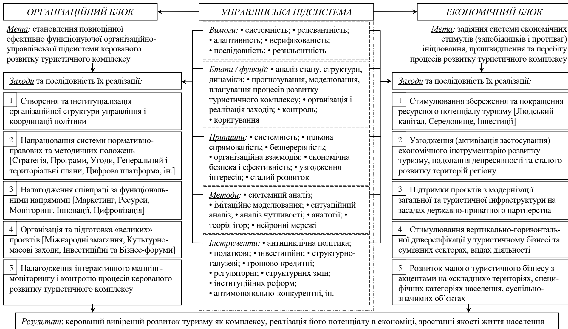
Рис. 3. Модель організаційно-економічного механізму розвитку туристичного комплексу Карпатського регіону України